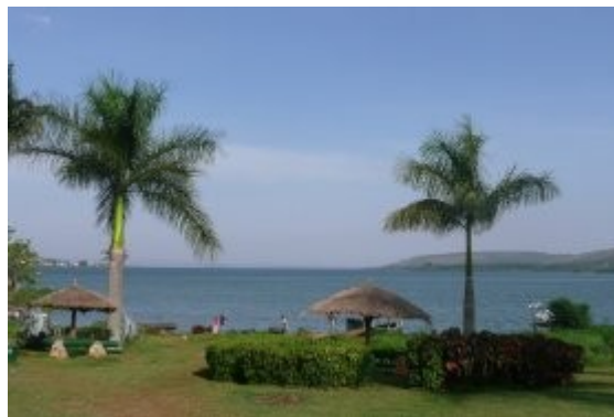
Areal nasej ubytovne, v pozadi Viktoriine jazero