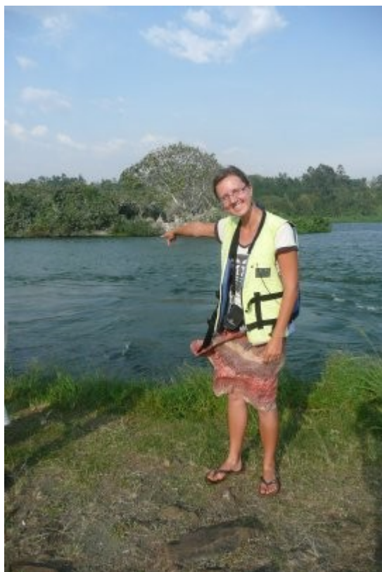
Tu, presne tu, prameni NIL!