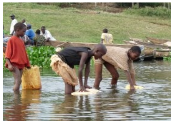
Jinja - takto sa chodi po vodu