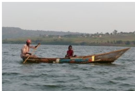
Jinja – rybari na Viktoriinom jazere