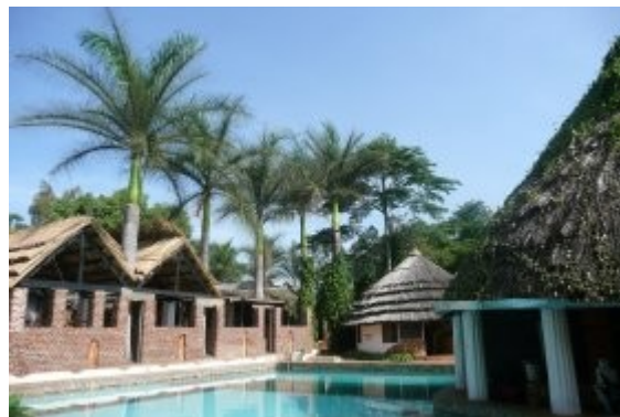
Jinja – tu sme byvali