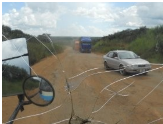
Zambia – pohlad cez predne sklo minibusu